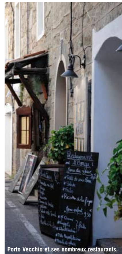
Porto Vecchio et ses nombreux restaurants.

Direction l'Alta Rocca, au cœur de la Corse du sud, pour des randonnées à pied, à cheval, en vélo ou pour le canyoning. Les plus beaux panoramas sont à apprécier à partir du col de Bavella (1.218m d'altitude). Pour redescendre, on choisit la côte des Nacres. Ici ça sent la terre, les pins, les fougères, le maquis, les bruyères... Plusieurs promenades littorales: «Testa», «Bruzzi» ou encore «Rundinara» vous feront découvrir les balades au fil de l'eau. Les cavaliers iront se baigner à cheval près de Bonifacio. Quant aux amateurs de golf, ils perfectionneront leur swing sur le sublime domaine 18 trous de Sperone.