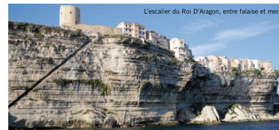
L'escalier du Roi D'Aragon, entre falaise et mer.