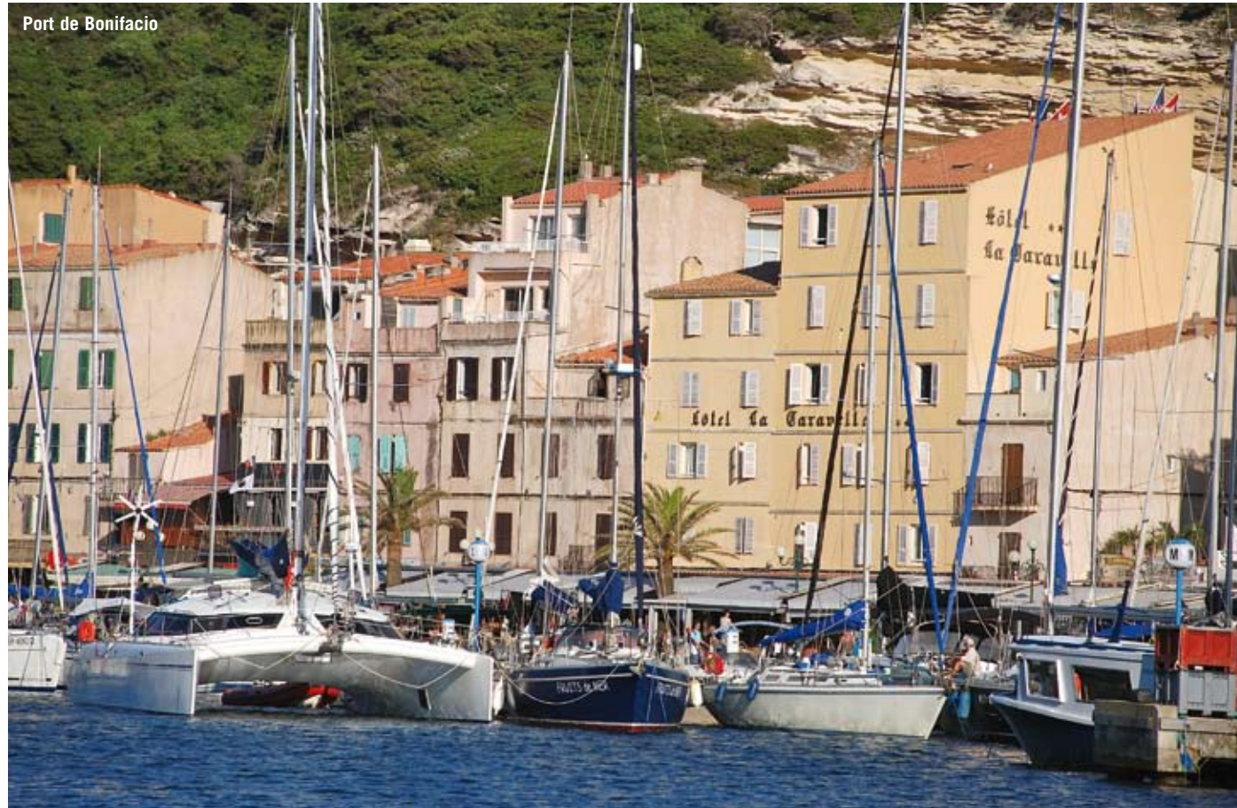
Port de Bonifacio